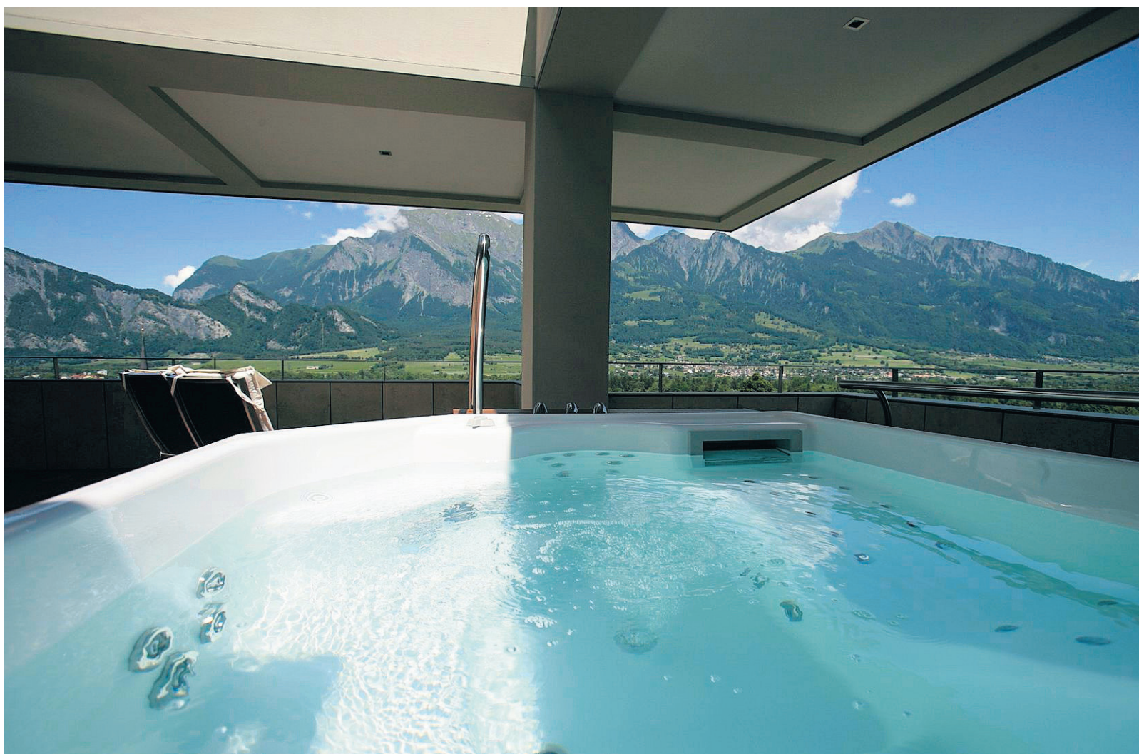
Pool der Penthouse-Suite mit einer Gesamtfläche von 440 Quadratmetern.

ST. GALLEN. Der Prix des Générations 2009 geht an das Internationale Komitee vom Roten Kreuz (IKRK), wie die World Demographic Association (WDA) mit Sitz in St. Gallen gestern mitteilte. Der mit 50000 Franken dotierte Preis wird am 5. September am World Ageing and Generations Congress an der Universität St. Gallen (HSG) übergeben. Er geht jeweils an Persönlichkeiten oder Organisationen, die sich in Alters- und Generationenfragen besonders verdient gemacht haben. (sda)