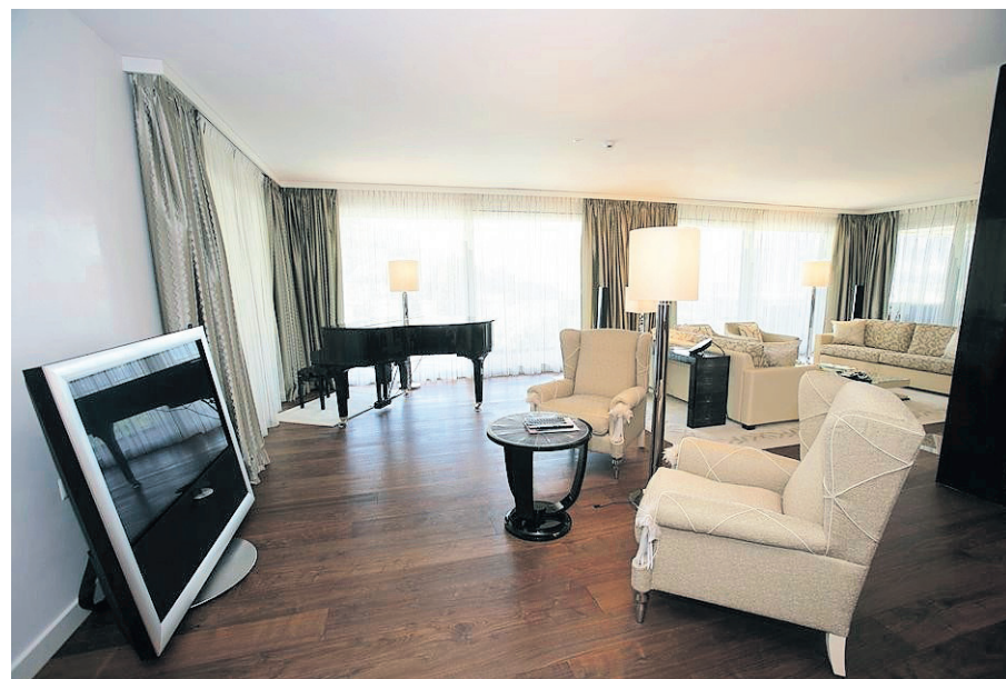
Jedes Einrichtungselement ein Luxusstück für sich.