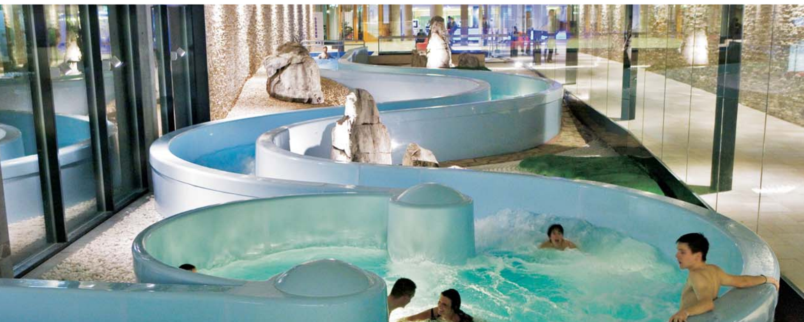
Einmaliges Badevergnügen im Hotel Säntispark.

Innenarchitektur: Claudio Carbone, Wolfhalden, Telefon 071 898 60 60, info@carbone-design.ch Hotel Säntispark, Abtwil, www.hotel-saentispark.ch