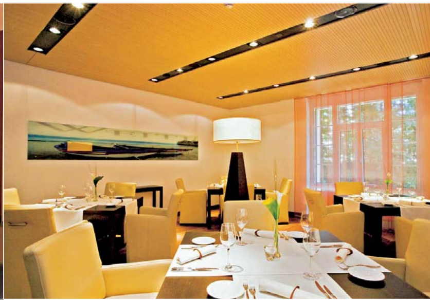
Stilvolles Ambiente im neuen Restaurant.

die in der Farbe kräftig gehaltene Möblierung. Eine neuartige Licht- und Bildertechnik und die silberfarbenen Einzelmöbel verleihen dem Zimmer die nötige Frische. Die Badezimmer sind mit Dusche oder Badewanne ausgerüstet, dazu kommt ein grosser Spiegel mit vielen Ablagemöglichkeiten.