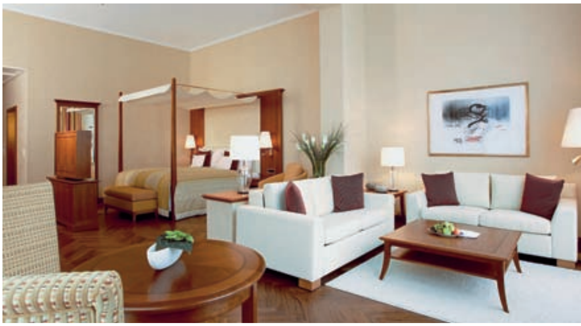
Klassischer Stil zeitgemäss umgesetzt: Die Grand Deluxe Suite im Hotel Hof in Bad Ragaz.

Wir möchten Wertigkeit schaffen. Um diese Wertigkeit zu schaffen, muss ich ein Gerüst haben. Anhand dieses Gerüsts frage ich mich, welche Ziele man erreichen möchte. Diesen versuche ich einen Inhalt zu geben,