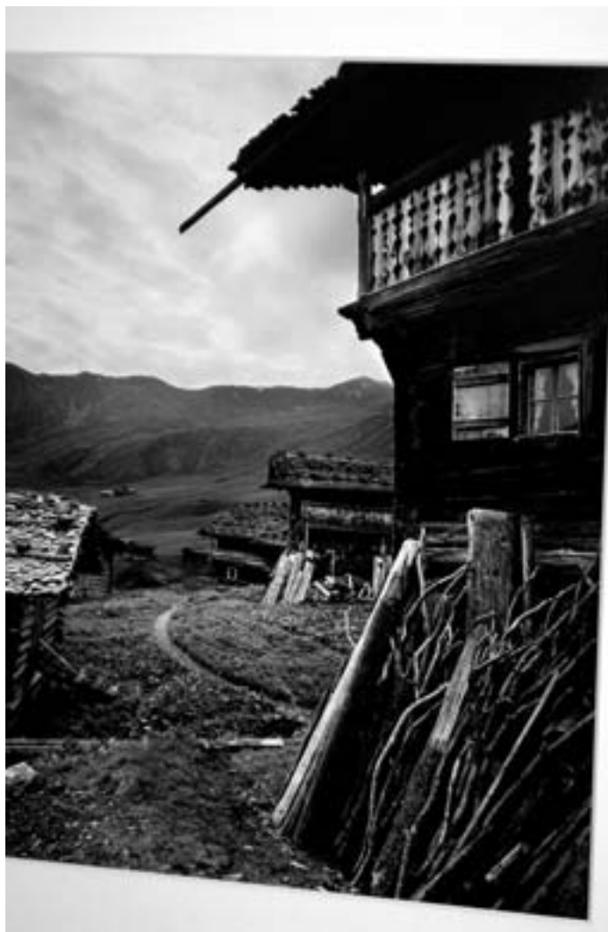
In den Gängen und auf den Zimmern im «Arosa Kulm» hängen moderne, dem alten Stil nachempfundene Bilder.

Mit ausgewählter Kunst an den Wänden lässt sich Ambiente und Corporate Identity schaffen. Hotels, die etwas auf sich halten, setzen deshalb vermehrt auf die Artwork-Karte.