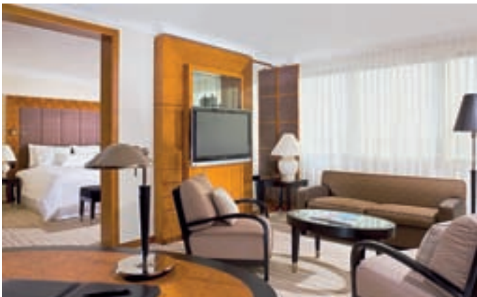
Warme Farbtöne vermitteln dem Zimmer im «The Westin Grand», München, ein angenehmes Ambiente.