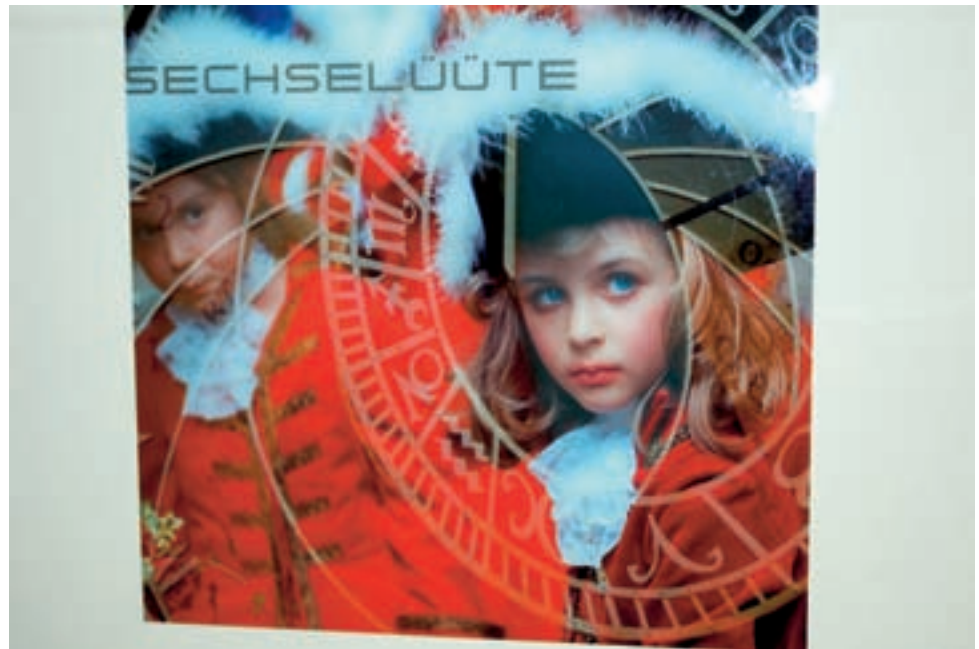
Die verfremdeten Sechselüuten-Motive zeigen im «Sheraton Neues Schloss» ein etwas anderes Bild von Zürich.