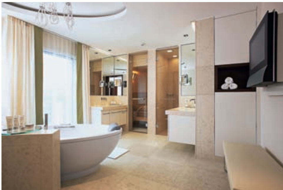
Luxuriöses Wohlbefinden: Badezimmer im Spa Tower, ebenfalls im «Grand Resort Bad Ragaz».

Element ist das Licht. Meistens wird viel zu viel Licht installiert, und es gibt fast keinen Schatten mehr. Gerade das Zusammenspiel von Licht und Schatten belebt den Raum. Wichtig ist, dass man auch Kontraste schafft, die den Raum zum Leben bringen. Dabei ist zu beachten, dass man Spannungen im Raum schafft, die aber nicht alle auf den ersten Blick erkennbar sind.»