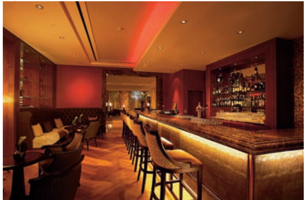
Für jeden Raum die passende Stimmung, hier die Hof-Bar im gleichnamigen Hotel des «Grand Resort Bad Ragaz».

Claudio Carbone: «Ein ganz wichtiges Element des Raumes ist der Boden, da er