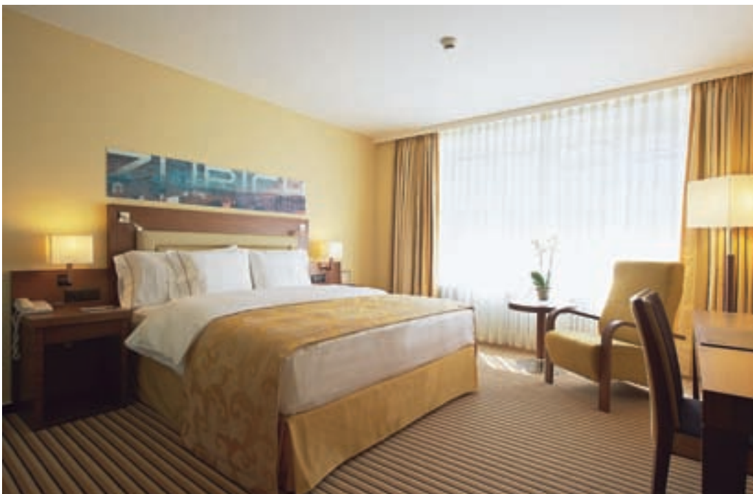
Carbone Interior Design versteht das Handwerk gelungener Raumgestaltung. Ein Zimmer im Arabella Sheraton Neues Schloss.