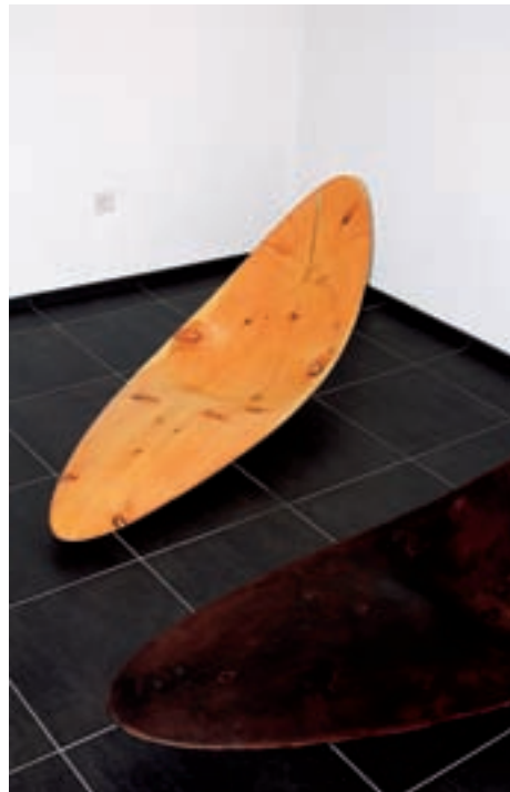
«GuardaVal» in Scuol: Holzliege vom einheimischen Holzschnitzer im Wellnessbereich.

Im Archiv wurde man auch im «Steigenberger Belvédère» fündig. Die Fotografien von der Küchenbrigade, von Orchestern, Kut-