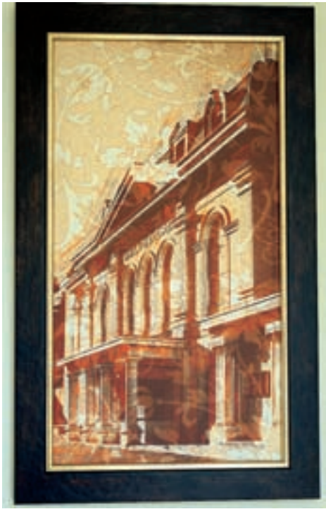
In einem aufwendigen Verfahren wurden die historischen Bilder vom Hotel Belvédère verfremdet.