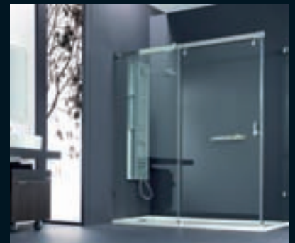
HÜPPE Manufaktur Vista