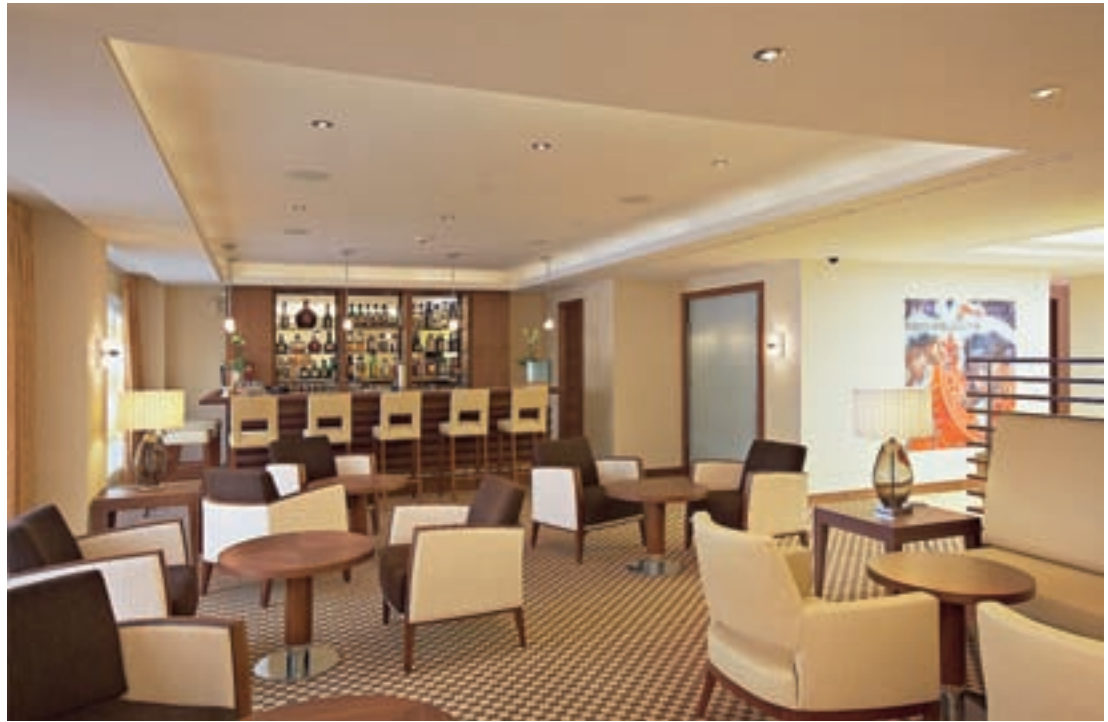
Stimmiges Ambiente in der Lobby und Bar des Hotels Arabella Sheraton Neues Schloss mitten in Zürich.

hen und ob er dem Zielpublikum entspricht. Die rasche Renovation ohne Konzept und Ziele garantiert langfristig keinen Erfolg.»