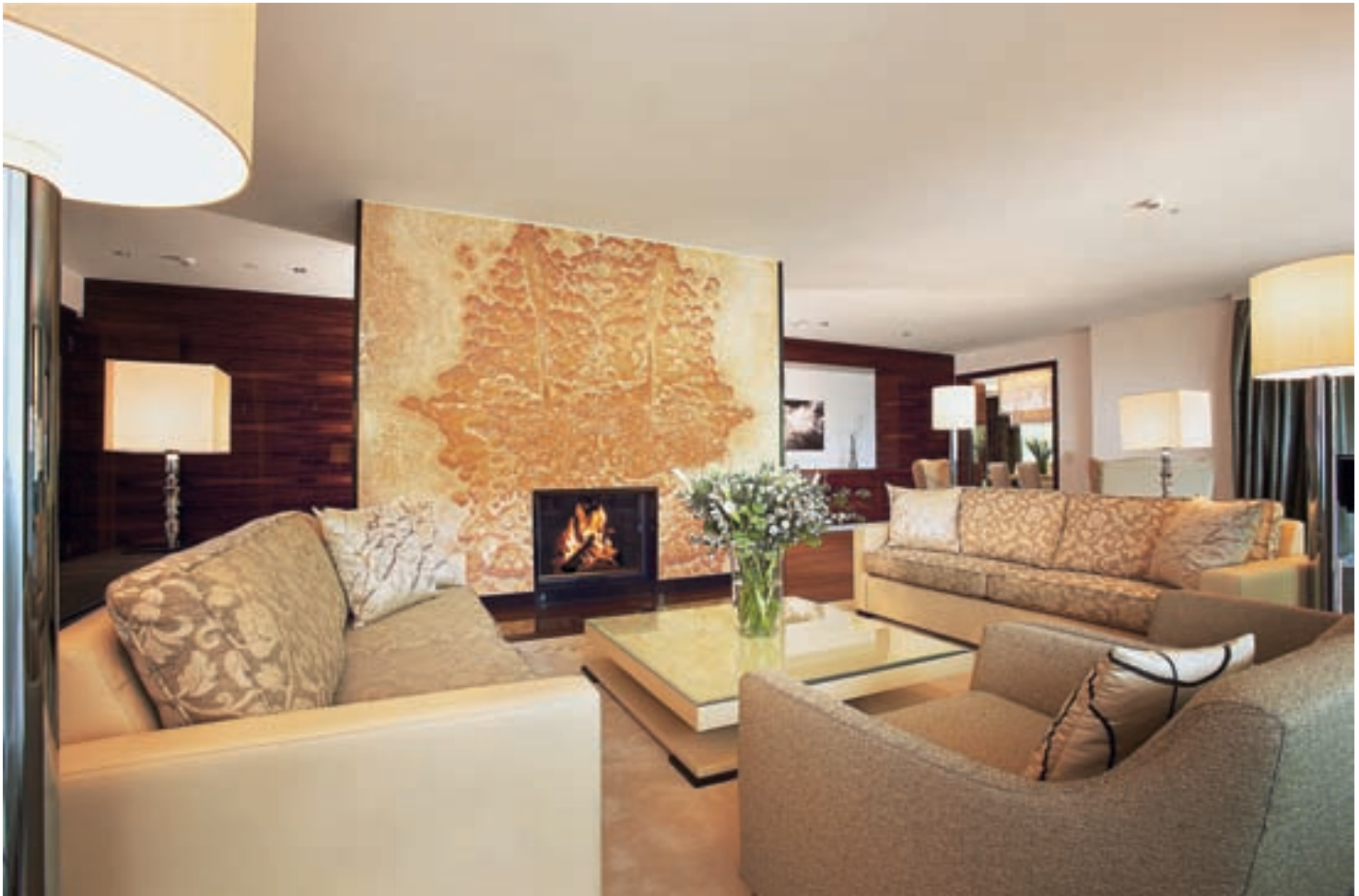
Grosszügigkeit: Das Wohnzimmer der Penthouse Suite im Spa Tower des «Grand Resort Bad Ragaz».

Carbone Interior Design ist spezialisiert auf hochwertige und einmalige Innengestaltung im Hotellerie- und Gastronomiebereich. Nachhaltigkeit schaffen, Gefühle wecken, Ambiente kreieren, Geist versprühen sind die Werte, die Carbone Interior Design in seinen Einrichtungswelten zum Ausdruck bringt. Darüber sprach das Schweizer Hotel-Journal mit Claudio Carbone.