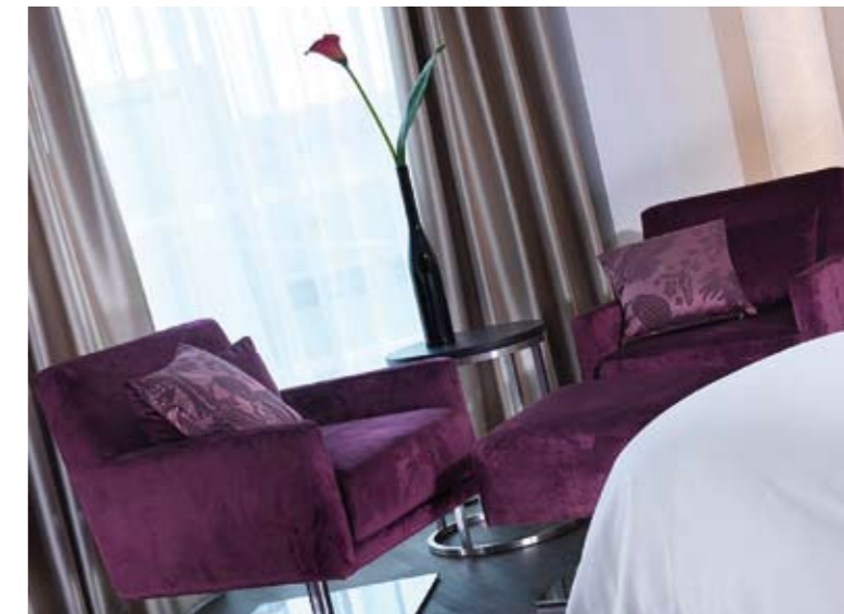
Die Ausstattung im Renaissance Zürich Tower Hotel schafft Identität und Charakter.