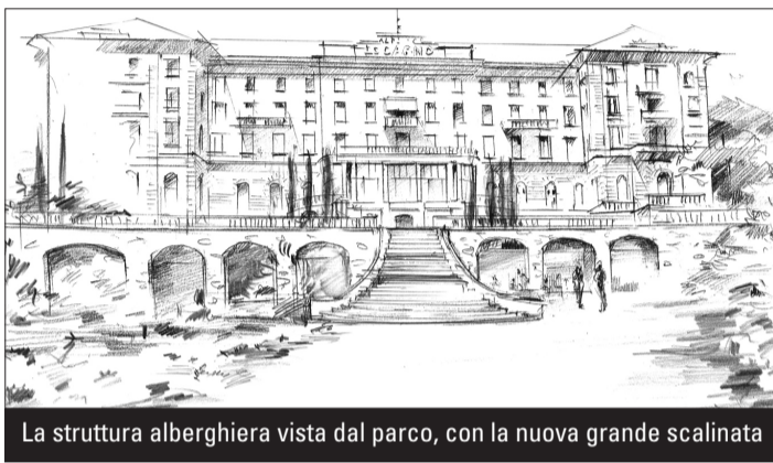
La struttura alberghiera vista dal parco, con la nuova grande scalinata

Il lavoro dell'azienda di Frauenfeld si sta sviluppando anche su altri fronti. Quello della compravendita immobiliare, iniziato con la stipula l'11 marzo 2010 di un diritto di compera, verrà concretizzato in due tappe: la prima è prevista dopo l'approvazione definitiva del Piano particolareggiato da parte del Consiglio di Stato (approvazione che è lecito attendersi nelle prossime